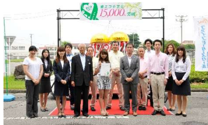
15,000人突破セレモニー