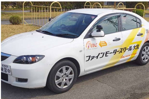
COOLCHOICEのラッピング教習車

教習所の枠を越えたエコドライブ普及啓発活動としては、環境省主導の「COOL CHOICE」に賛同し、地球温暖化対策に資する賢い選択の一つとして設定されている「エコドライブアクション」を推進しました。地域の方がエコドライブに興味を持つきっかけとなるよう、教習車や送迎バスをラッピングし(2016年)、地域の親子を対象にした森づくりプロジェクト(2010年開始)では、森づくり活動の団体に継続的に寄付をするほか、不要な木を間伐する「育林活動」を通じて、エコドライブと地球環境全体の関係性について説明しています。これらの取り組みは、各褒賞制度で評価されました(※2)。