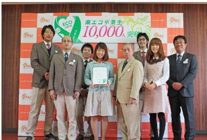
10,000人突破セレモニー

卒業生には埼玉県より、エコドライブの知識を得たことを意味する認定証「エコドライブアドバイザー証」が交付されるほか、当スクールオリジナルで、車載していつでもエコドライブの確認ができるようになっている楽エコ認定証を発行しています。また、「卒業生燃費追跡プロジェクト」の調査対象者として、一定期間に数回の燃費計測を行います（※1）。これらの取り組みは、卒業後もエコドライブを必要不可欠で身近なものとして捉え、継続できる環境作りに役立つよう、今後も継続して実施します。